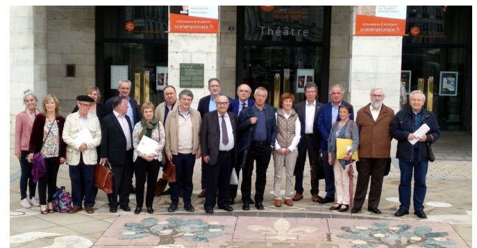
Maiatzean, Baionan egindako osoko bilkura