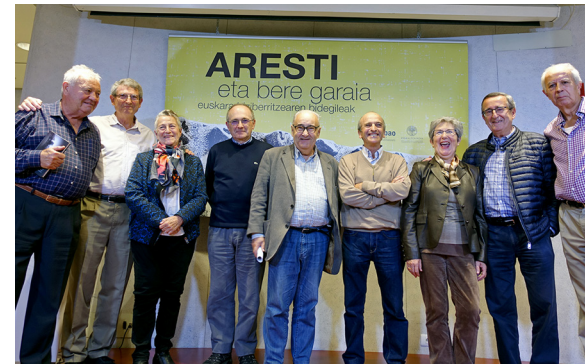
Gabriel Arestiren garaiari buruzko jardunaldian parte hartu zuten kideak