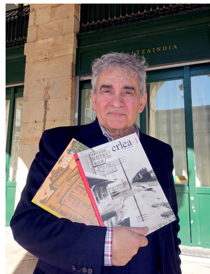
Erlearen lehen eta azken zenbakiak

2018an, aldizkariaren 12. zenbakia kaleratu da.