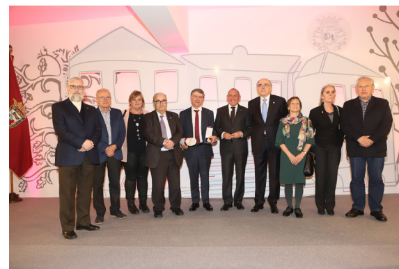
Euskaltzaindiko ordezkariak Arabako Foru Aldundian