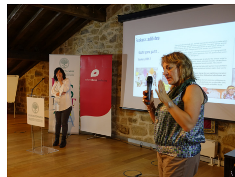
“Euskara batua eta tokian tokiko erabilera: korapiloak eta erronkak” jardunaldia