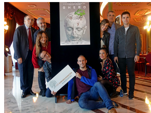
Ghero antzerki-lanaren aurkezpena