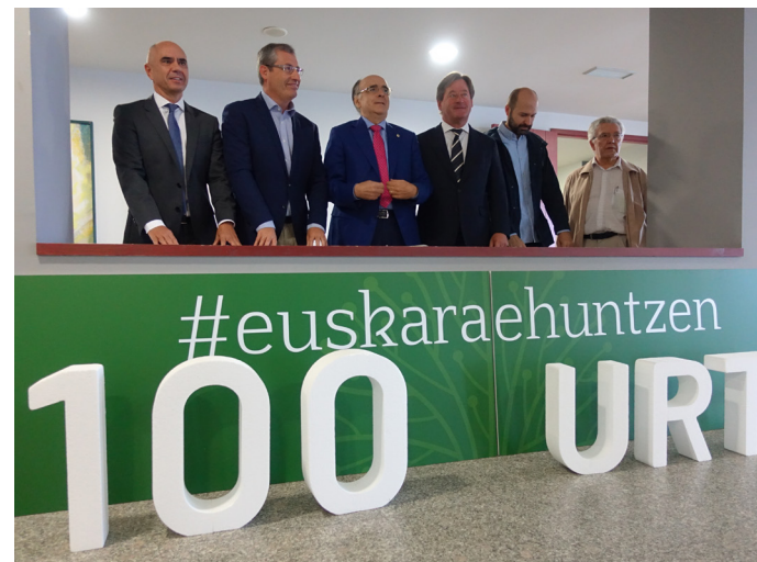
Biltzarreko antolatzaileak, babesleak eta herri erakundeetako ordezkariak