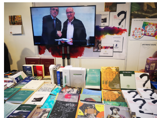
Euskaltzaindiaren saltokia Durangoko Azokan

Abenduaren 5etik 9ra Euskaltzaindia Durangoko 52. Liburu eta Disko Azokan egon da. Durangokoa erreferente garrantzitsua da euskal kulturarentzat, eta Euskaltzaindiak lehenengo ediziotik hartu du parte. 2018an, beste argitalpen batzuekin batera, nobedade bi aurkeztu dira: Euskara Batuaren Eskuliburua eta Erlea aldizkariaren 12. zenbakia.