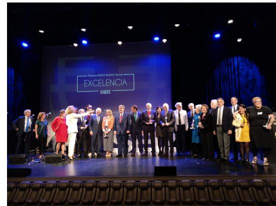
Radio Bilbaoren Bikaintasun Sariak

Apirilaren 17an, Bilboko Alhondegian (Azkuna Zentroa), Euskara ataleko Radio Bilbaoren (SER irrati katea) Bikaintasun Saria jaso du Euskaltzaindiak. Honela, ehun urtez Akademiak "euskararen zaintzan eta erabileran egindako lan eskergea" saritu nahi izan dute Radio Bilbao irratiko arduradunek.