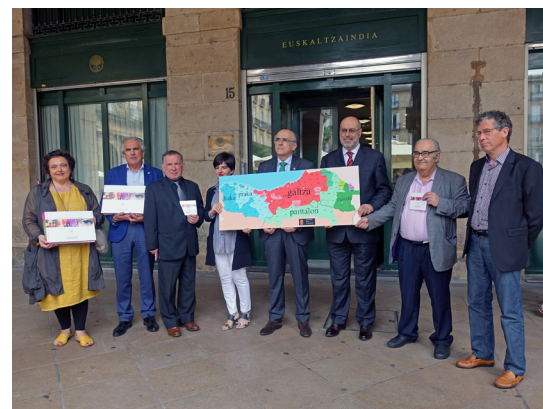
Atlasaren IX. liburukian parte hartu zutenak: babesleak eta erakundearen ordezkariak