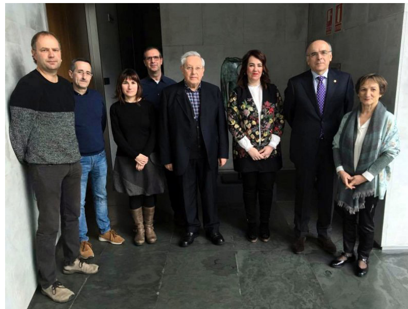
Nafarroako Parlamentuko kideak eta Euskaltzaindiaren ordezkariek

Ortzadar LGBT elkarteak eta Euskaltzaindiak lehenengoz sinatu dute lankidetzaz hitzarmena. Hitzarmena hiru urterako egin da. Euskarari dagozkionetan, eta Euskaltzaindia erakunde aholkuemaile ofiziala den aldetik, Ortzadar LGBT elkarteari aholkularitza eskainiko dio, bereziki: