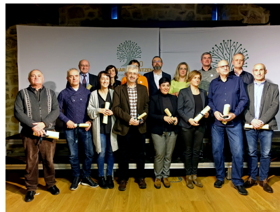
Euskaltzain urgazleak diploma jasotzen