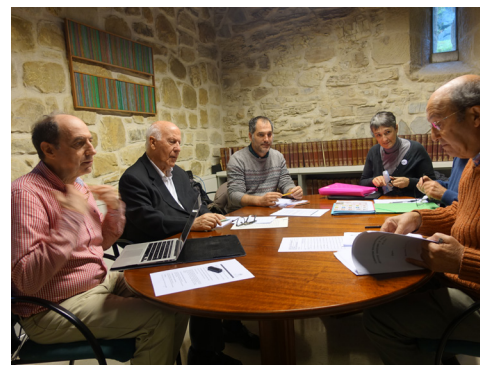
Euskal Literatura Antologiaren lantaldea