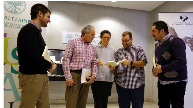
Egileetako batzuk eta UPV/EHU eta Euskaltzaindiaren ordezkariak Esteve Materraren Do(c)trina christiana (1617 & 1623) liburua aurkezpenean

1968an, Arantzazuko santutegian egindako biltzarrean sortu zen euskara batua. Berrogeita hamar urte berantago, euskara batua sortu zen leku berean, Euskaltzaindiak XVII. Biltzarra egin du, eta, urriaren 5ean, biltzar horren egitarauaren barnean, Euskara Batuaren Eskuliburua argitalpena aurkeztu da. Argitalpen honek etenik gabeko bertsio eguneratua izango du Euskaltzaindiaren webgunean. Lan honen helburu nagusia da Euskaltzaindiak bere historian zehar eman dituen arauak eta gomendioak modu didaktiko batean birformulatzea. Liburuan, era agerikoan erakusten da zer den arau eta zer ez, zer den arautua dagoena eta zer den gomendioa.