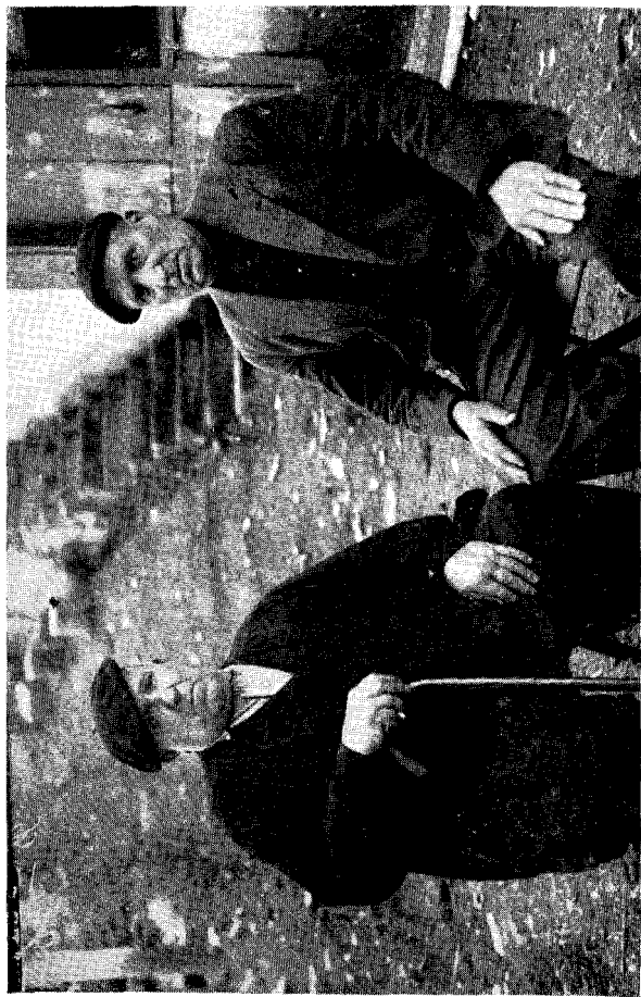
Txirrita ta Saiburu Eibarren, 1930