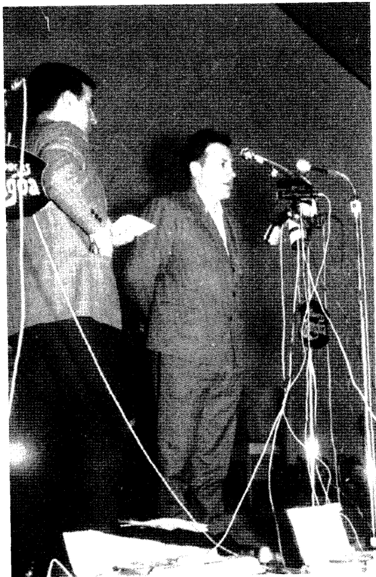
Mugartegui bertsoan. Donostia 1968.