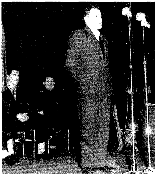
Mugarategi Donostiako txapelketan Atzean, Azpillaga eta Mitxelena

Nar: Ni Donostian oso gutxitan izana naiz oraindikan. Biotz barrendik gaur'e ez daukat etortako damurikan. Neure denboran eztet ikusi onelako lorerikan... Gaur mundu ontan ez da izango leku ederragorikan.