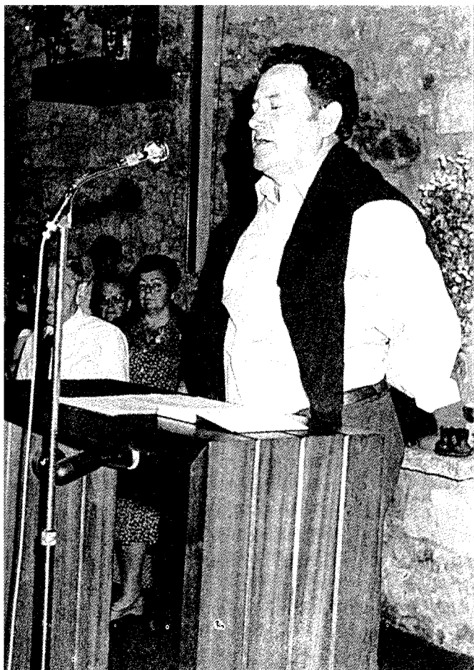
Mugartegi Urkiolako elizan